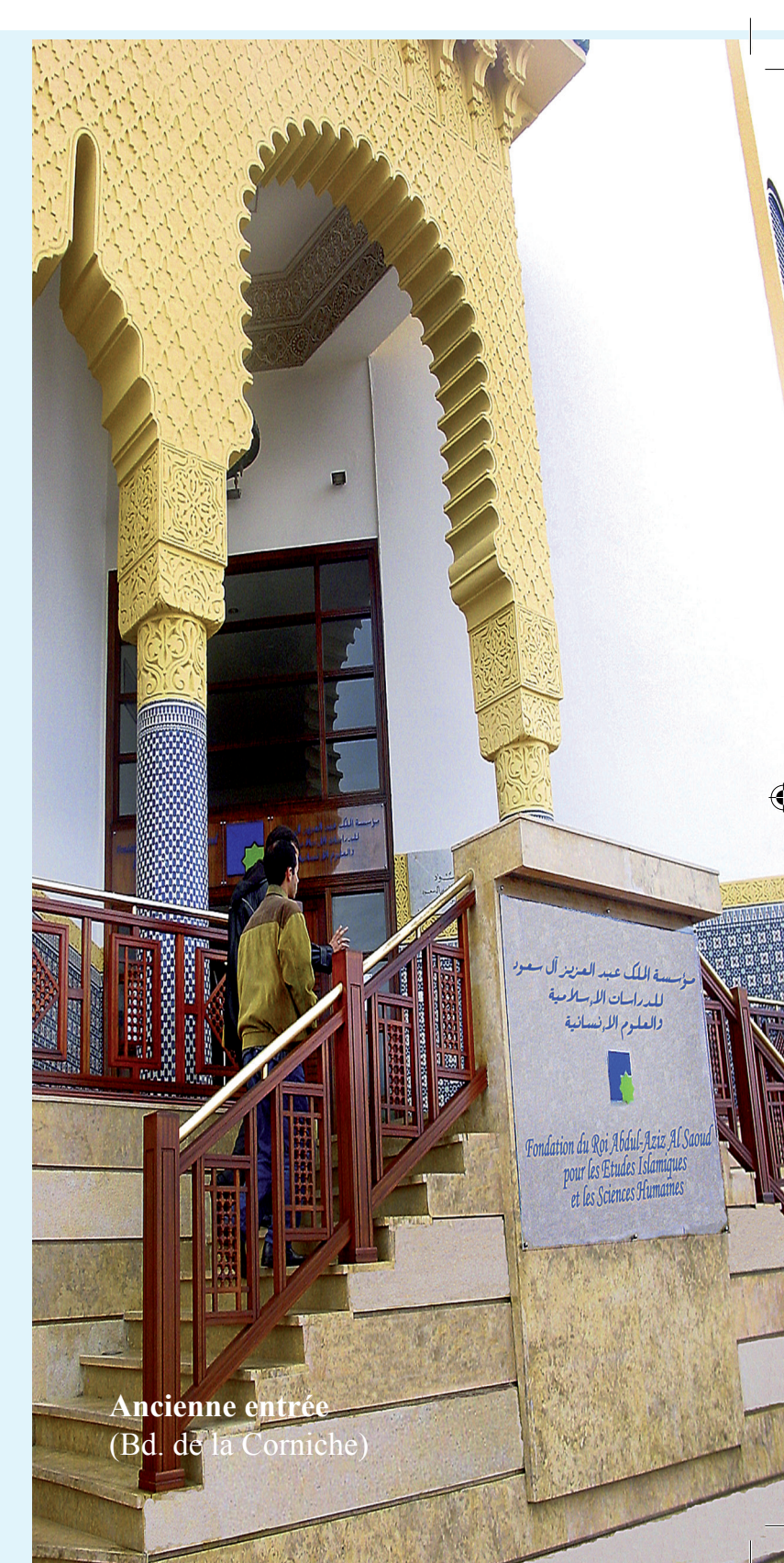
Ancienne entrée (Bd. de la Corniche)