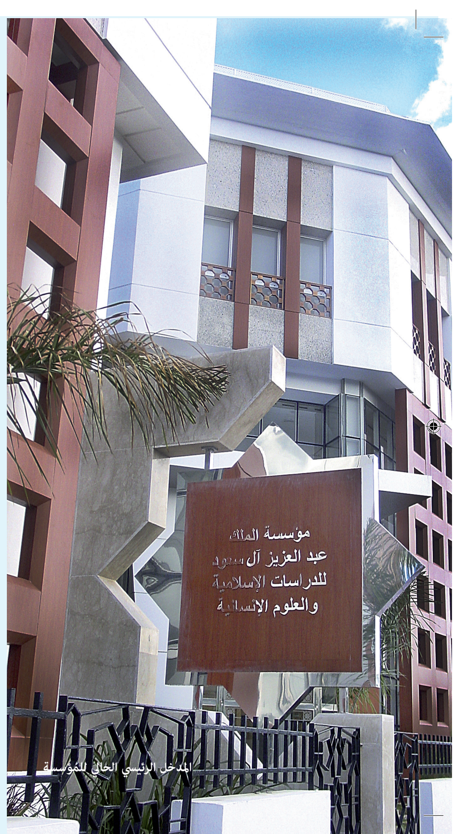
المدخل الرئيسي الحالي للمؤسسة

- تخضع خدمات النسخ لقوانين الملكية الفكرية المعمول بها في المغرب.