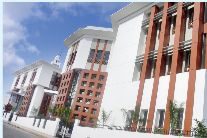
التوسعة الجديدة لبنانية المؤسسة المنجزة سنة 2005

– فضاء للنشاط العلمي (ندوات، مؤتمرات...): يسمح بقيام الحوار الفكري والتبادل العلمي والثقافي بين الباحثين والمفكرين من داخل المغرب وخارجه (انظر فهرس منشورات المؤسسة). وقد أطلقت المؤسسة في سنة 2008 مشروعا لنشر الأطروحات والرسائل الجامعية في إطار برنامج دعم الباحثين الشباب.