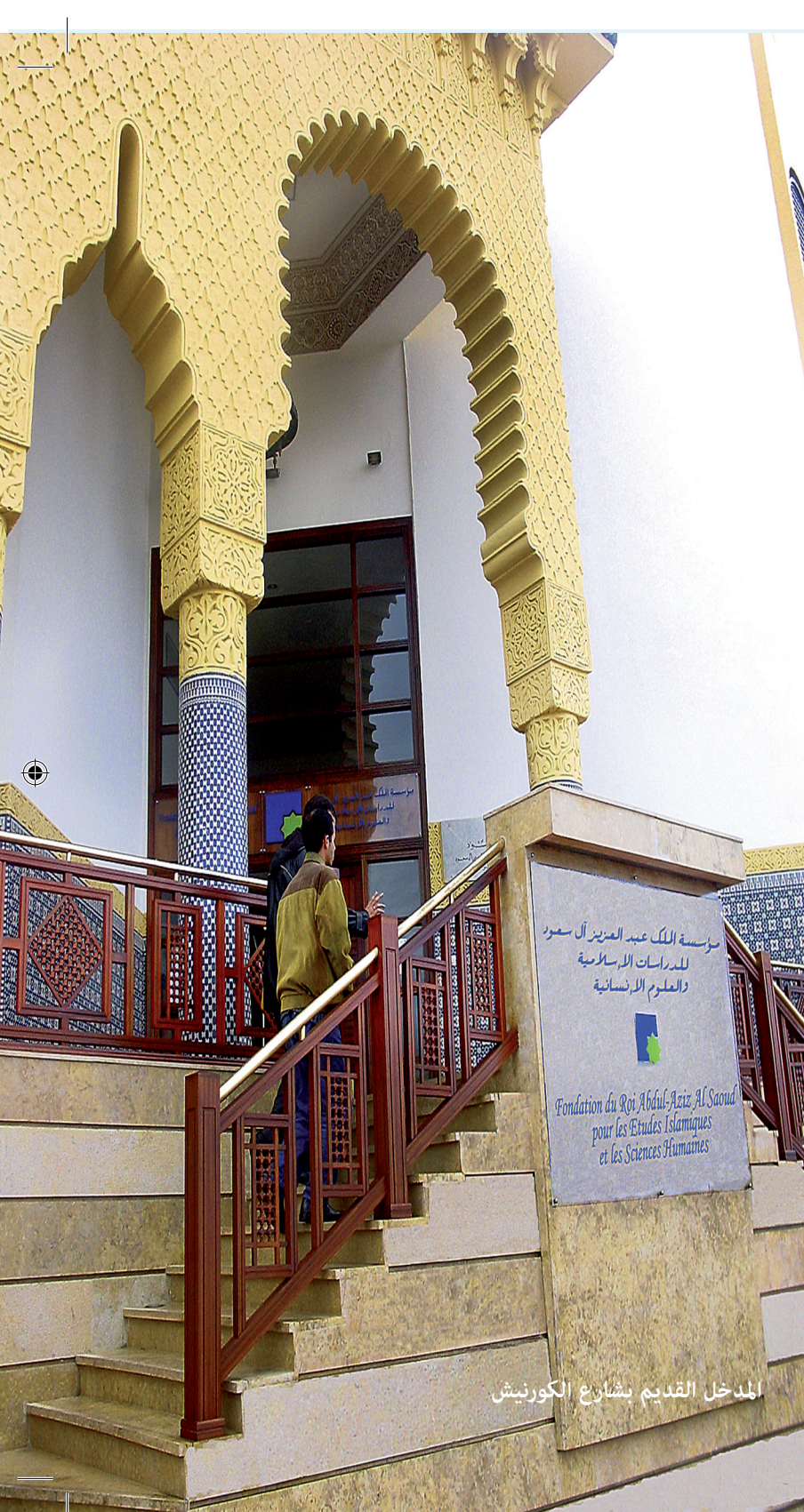
المدخل القديم بشارع الكورنيش